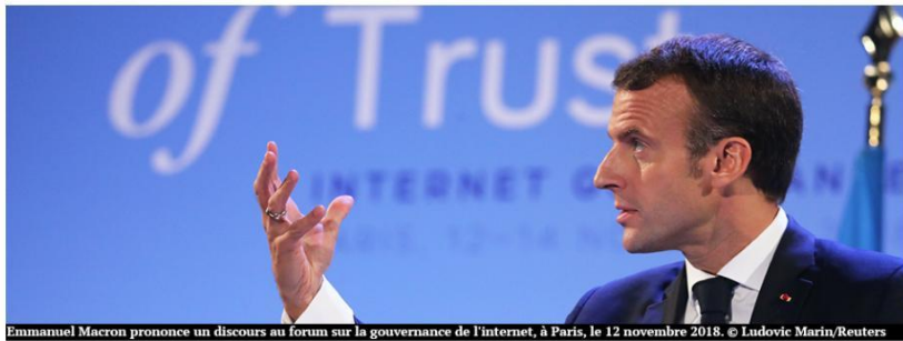
Emmanuel Macron prononce un discours au forum sur la gouvernance de l'internet, à Paris, le 12 novembre 2018.

Pourtant, les renseignements généraux viennent nous compter et relever nos plaques d'immatriculations !